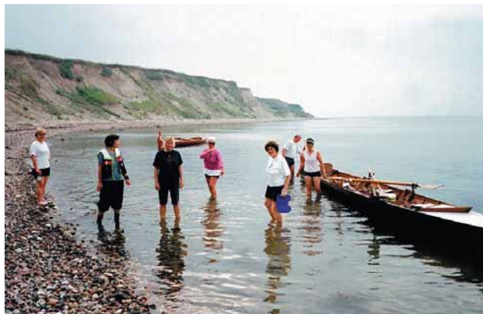
Fra en af sommerens madpakketure