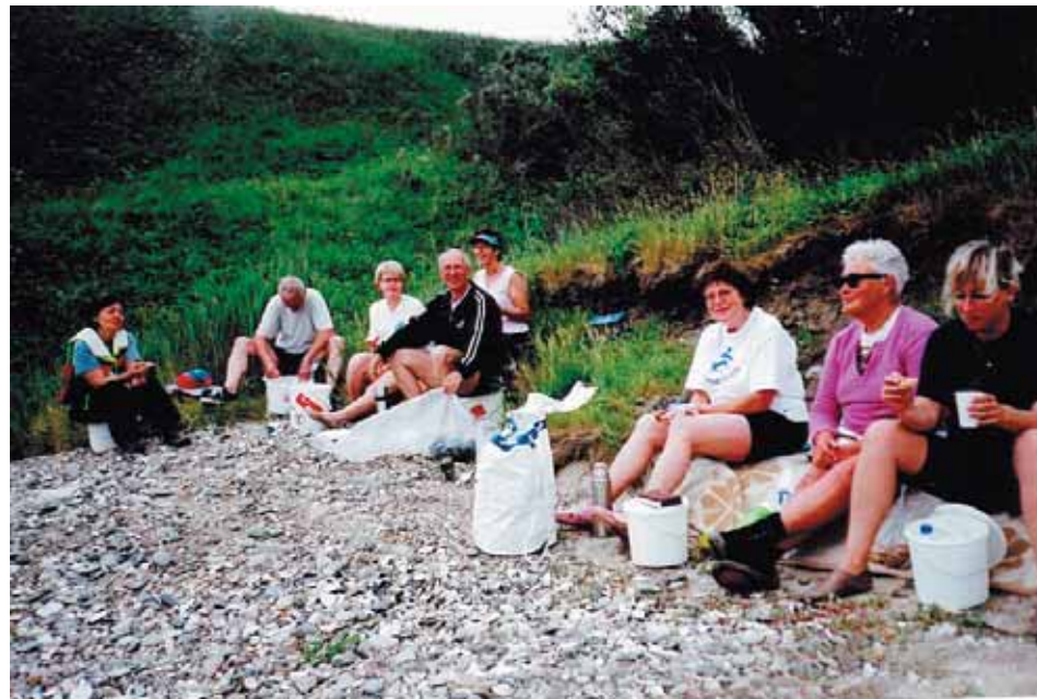
Fra en af sommerens madpakketure