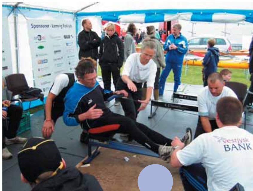
24 timers roning 2006