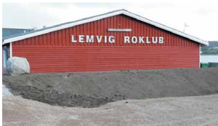
Det nye højvandsdige